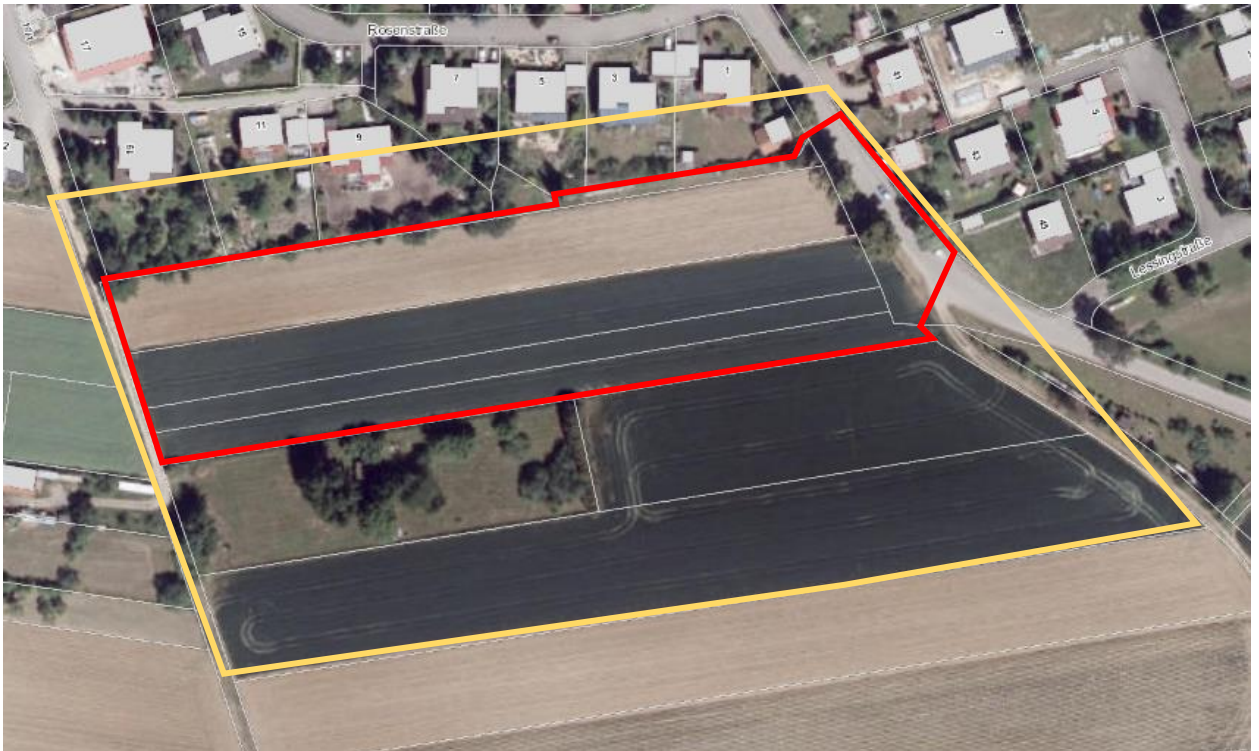
Abb. 1: Untersuchungsgebiet.

Die Plangebiete befinden sich am südlichen Ortsrand Oberstotzingen. Die Grundstücke im Geltungsbereich werden überwiegend als Ansaatgrünland genutzt. Nach Norden grenzt der bestehende Ortsrand mit Wohnbebauung und Gärten an. Im Süden schließt sich ein Grundstück mit Grünland und Feldgehölzen sowie Ackerflächen an. Das Gelände steigt nach Süden stark an.