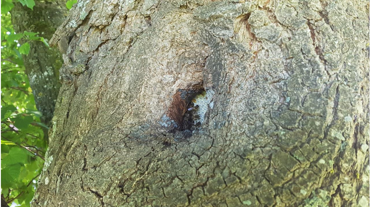
Abb. 3: Baumhöhle mit Bienenschwarm