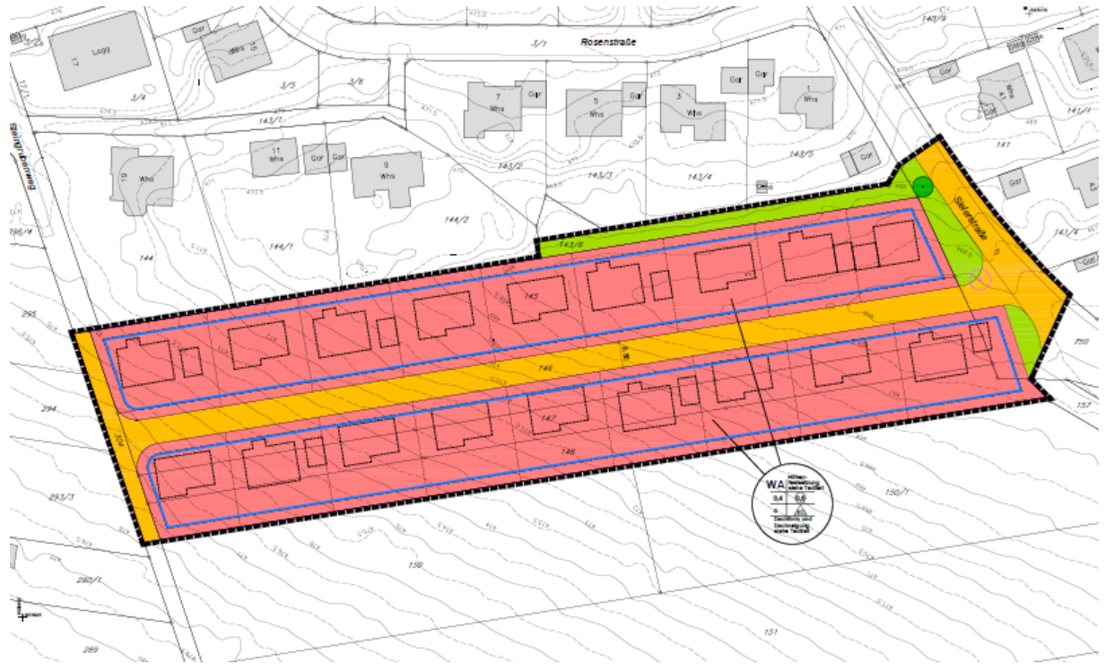
Abb. 2: Auszug B-Plan (Ingenieurbüro Gansloser 2018)